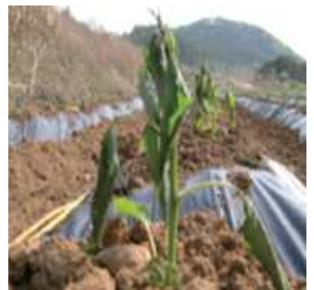
<고추 저온에 의한 피해 모습>