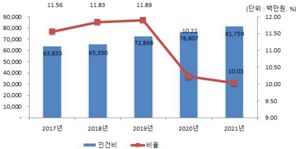
인건비 연도별 변화